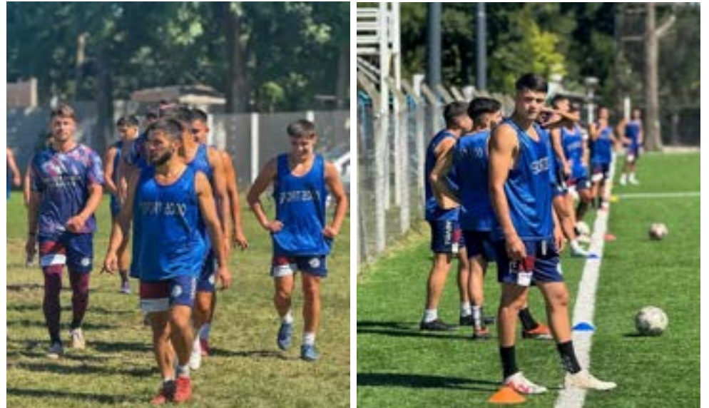
El plantel de Deportivo Merlo entrenando en el Remanso.