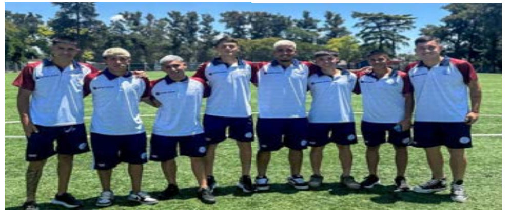
Ocho pibes de las inferiores integran el plantel de primera.