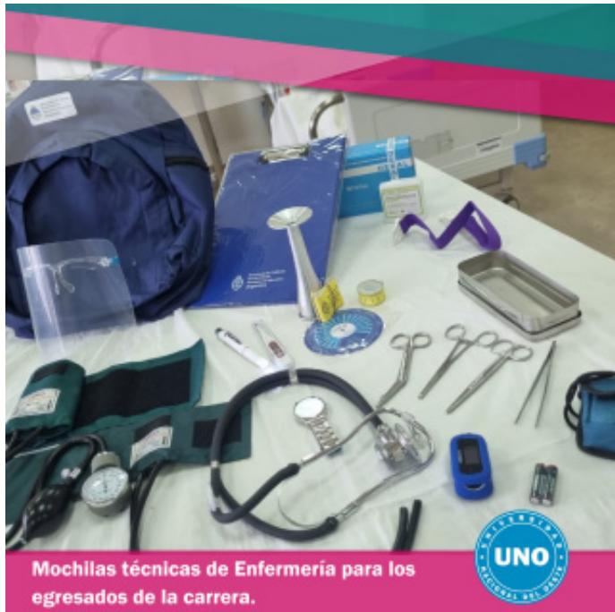
Mochilas técnicas de Enfermería para los egresados de la carrera.

Las mochilas serán entregadas a los estu-